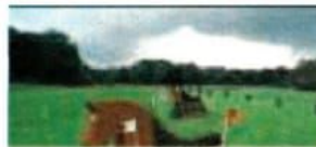
3 Hobby Horse