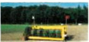
16 Oxer an der Bever