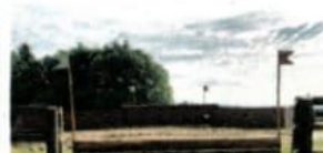
19 Steinmauer a/b