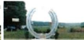
20 Hufeisen / Horseshoe