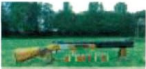
17 a Flinte vor Wasser