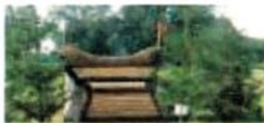
2 Fly'n Rush