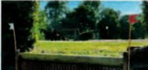
17 b Aufsprung Wasser