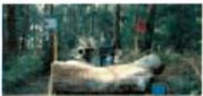
12 Crown on Cross