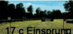
17 c Einsprung Wiese