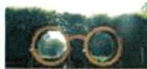
4 Blomes Brille / Blomes glasses