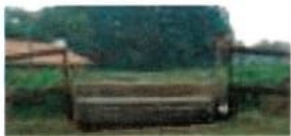
1 Sägewerk / Sawmill

Layout: PDA PLANUNGSGRUPPE DÖRENKÄMPER + AHLING PDA Planungsgruppe Dörenkämper + Ahling GmbH & Co. KG Hauptstraße 108 • 48346 Ostbevern Fon.: (02532) 95 601-00 Fax: (02532) 95 601-29 www.pda-planungsgruppe.de