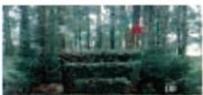
10 a/b/c Trippelhecke