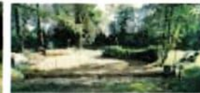
7 a/b Provinzial Komplex