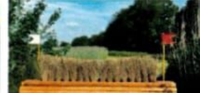
5 a/b Dieters Bürstensprung