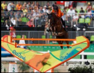
Vater Emerald van het Ruytershof Olympische Spiele 2016 in Rio de Janeiro