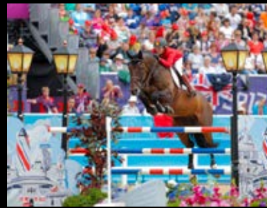
Mutter Bella Donna von Baldini II Olympische Spiele 2012 in London